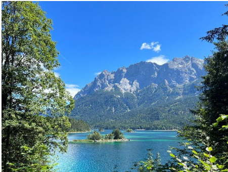
Foto 2: De Eibsee op de grens met Duitsland en Oostenrijk. Zo mooi blauw! De kleur van het geloof. Mijn moeder had het op haar sterfbed erover dat ze zulke mooie blauwe kleuren zag. Daar moest ik aan denken toen ik in deze prachtige natuur was.

Toen ik dit in het echt zag, dacht ik meteen aan iets 'Hemels'. Een teken van Gods trouw. En dan ook nog in zo'n prachtige omgeving.